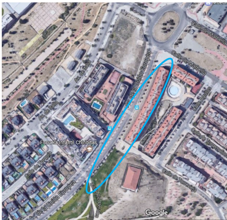
Tramo 2: Entre C/ Marbella y C/ Río Perales (calle peatonal)